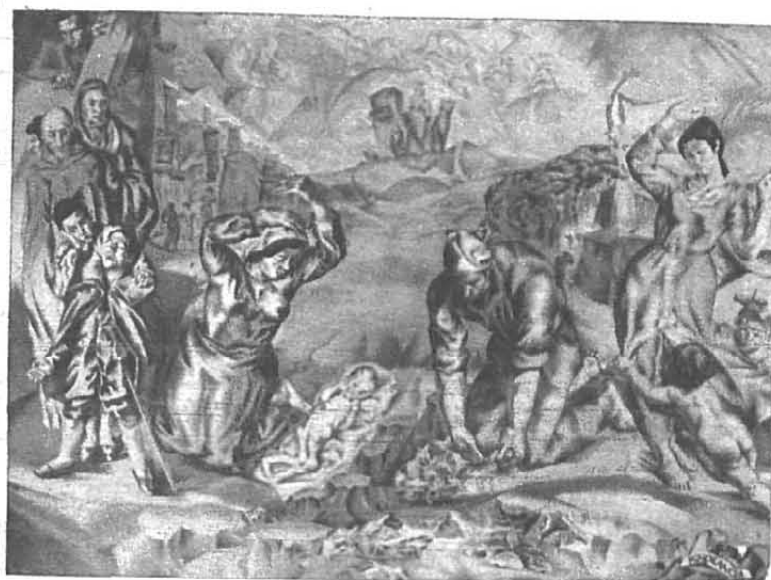
Frescos que decoran algunos pabellones de la Ciudad Universitario pintados por el notabilísimo artista Luis Quintanilla