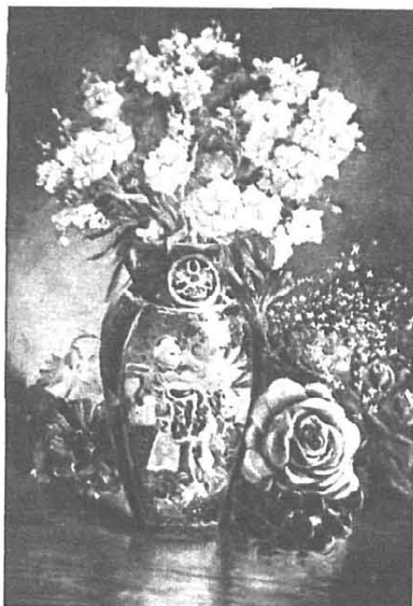
«Jarrón y flores», cuadro del doctor Jorge de la Guardia

En el reciente Salón de Otoño, y en la sala donde se reunieron precisamente obras de maestros, se destacaba por su gracia fresca, espontánea; por el grato cromatismo, por el encanto atmosférico