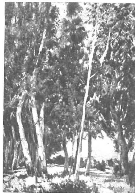
«Arboles de Granollers», cuadro de Vicente Albarranch (Salón de «Heraldo de Madrid»)