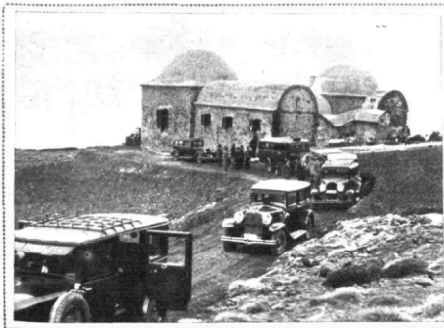
Granada.—Los albergues de la Sociedad Sierra Nevada