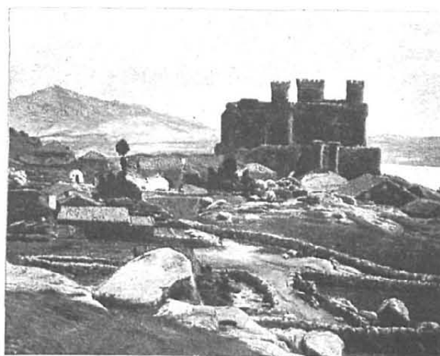
«Sol de Castilla», cuadro del doctor Eduardo Alfonso

de su veracidad natural, el lienzo de un joven pintor catalán: Arboles de Granollers .