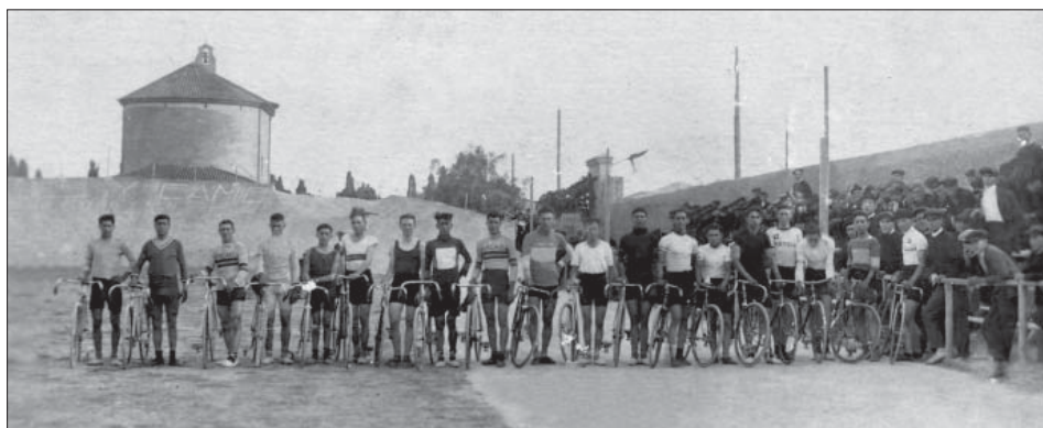
Velòdrom de Vila-real