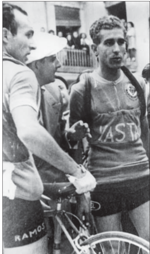
Bahamontes, maig de 1954. Eixida Vila-real - Morella

Amb aquestes línies finalitze les dades per a la història de l'esport a Vila-real.