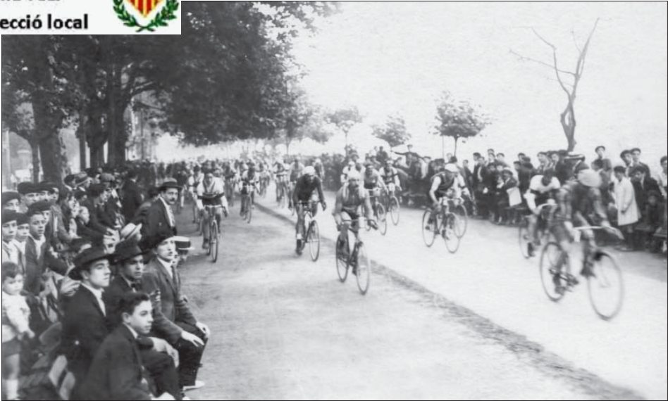
Passeig de Ribalta de Castelló

carreres ciclistes i la petició va ser acceptada. La primera carrera de bicicletes celebrada a Espanya va ser el dia 10 de setembre de 1870, al parc del Retiro a Madrid.