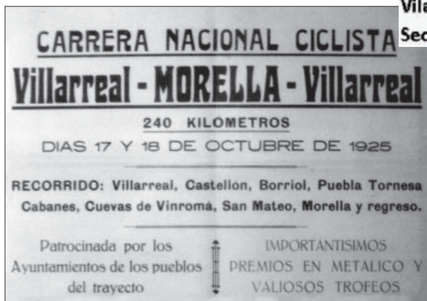
Cartell de la carrera

portava un vencedor que mai va córrer aquesta gran carrera.