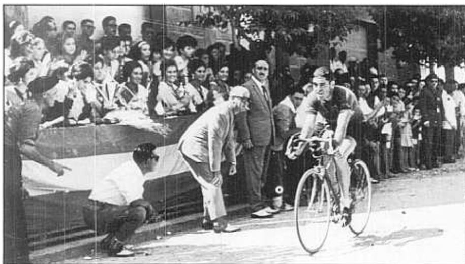
FINAL DE LA CARRERA VILA-REAL-MORELLA, DE GRAN TRADICIÓ, AL CIRCUIT DE L'AVINGUDA DEL CEDRE.

per a les dames (6) . Com es pot apreciar, per uns pocs gallets es podia passar una vesprada molt entretinguda. Per la documentació que podem abastar, a més, es comprova a més que l'afició per la bicicleta no es limitava al velòdrom, sinó que també era a la carretera, en desplaçaments per les comarques, en forma de curses organitzades pels ajuntaments o, simplement, desafiaments que portaven els aficionats fins a Vinaròs o Terol.