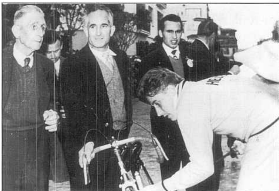
EL GRAN CAMPIÓ JACQUES ANQUETIL VA GUANYAR L'ANY 1958 EL SEGON TROFEU «LLORÉNS». A L'ESQUERRA, PASCUAL PORÉ, SEMPRE PRESENT.