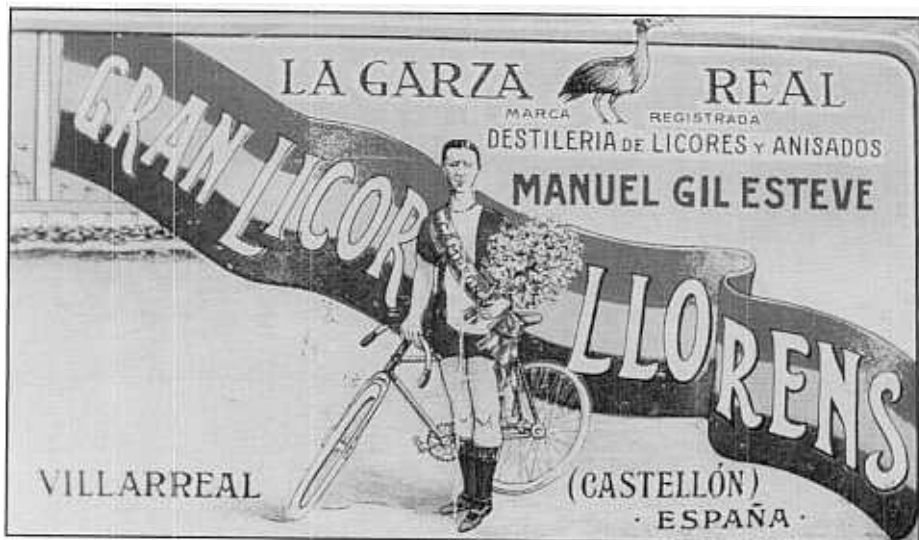
ELS ÈXITS DE LLORÉNS VAN TENIR RESSÓ EN MOLTS ÀMBITS. DES DEL PASSADOBLE QUE LI VA DEDICAR GOTERRIS, FINS A UN LICOR.

de Betxí, les Escoles Municipals desenvolupades als darrers anys, el club ciclista «T. Camarga», i tot un fum de veïns que, sobretot en arribant el bon temps, omplim les carreteres dels nostres voltants (3) .