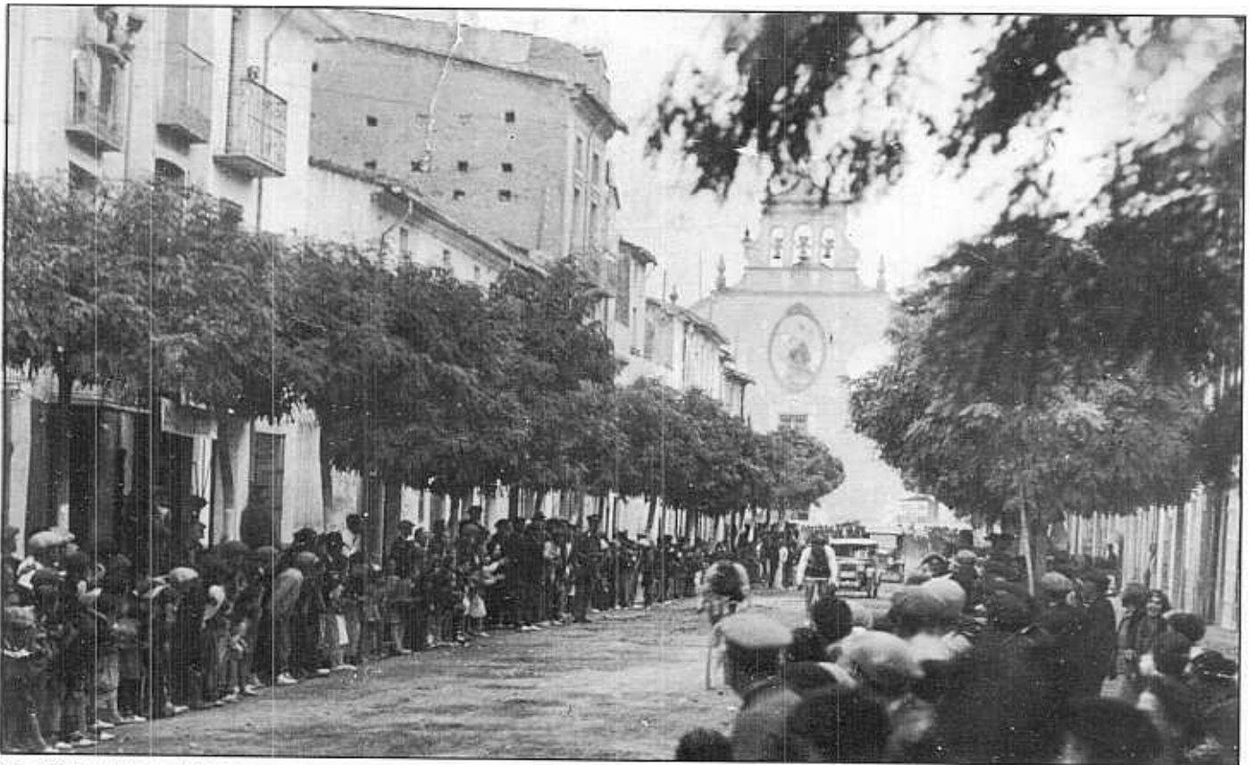
1926. ARRIBADA DE LA CARRERA VILA-REAL-VINARÓS AL RAVAL DE SANT PASQUAL.