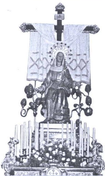
Ntra. Sra. de las Angustias