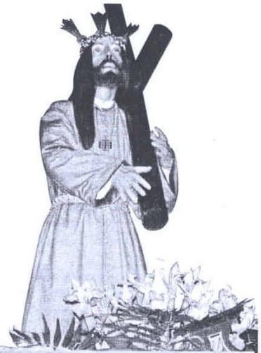
Ntro. Padre Jesús el Nazareno