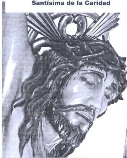
Cristo del Silencio